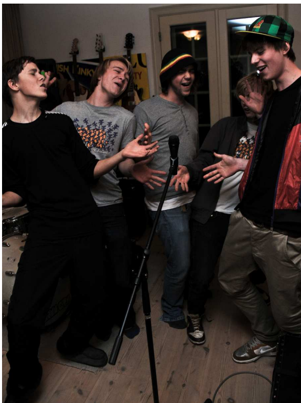
Elefanatic, også kendt som de ’norske bøssesvende’, synger i fællesskab en smuk og næsten ren version af en dejlig julesang.